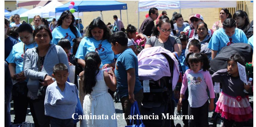
Caminata de Lactancia Materna

Lo que debe saber antes de tener a su bebé